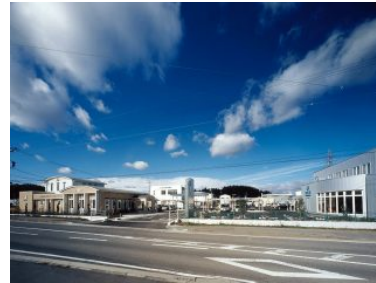
津メディカルモール