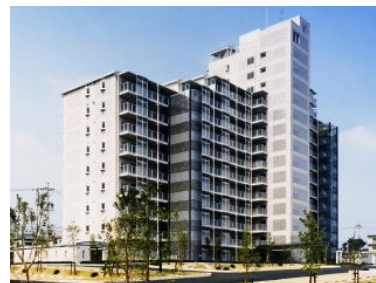
三重県営住宅サンシャイン千里団地