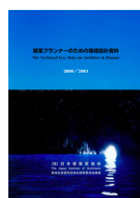
建築プランナーのための 環境設計資料 (日本建築家協会刊、共著)