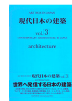
現代の日本建築 vol.3 (ART BOX IN JAPAN)