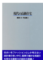
現代の高級住宅 ( ) (日本工業新聞社刊)