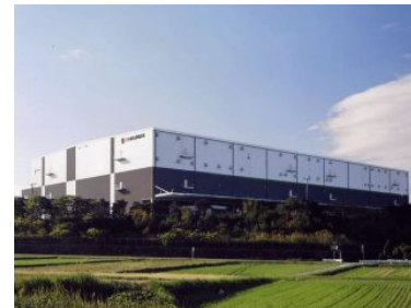
日本梱包運輸倉庫 愛知流通センター