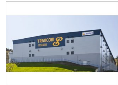
トランコム(株)静岡ロジスティクスセンター