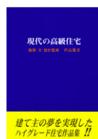
現代の高級住宅 ( ) (株式会社SCC刊 '0610)