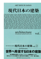
現代の日本建築 vol.2 (ART BOX IN JAPAN)