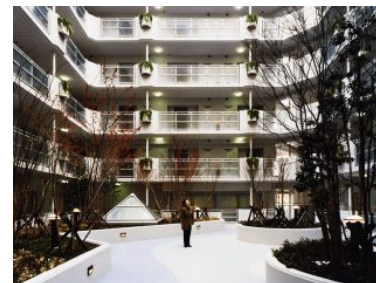
パルテノンリンデン