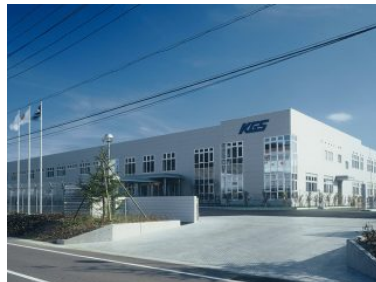
北川工業明知テクノセンター