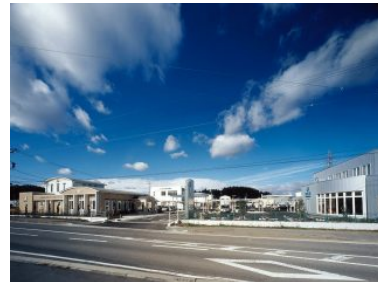
津メディカルモール