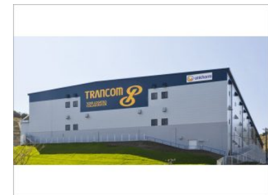
トランコム(株)静岡ロジスティクスセンター