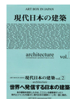
現代の日本建築 vol.2 (ART BOX IN JAPAN)