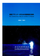
建築プランナーの為に 環境設計資料 (日本建築家協会刊、共著)