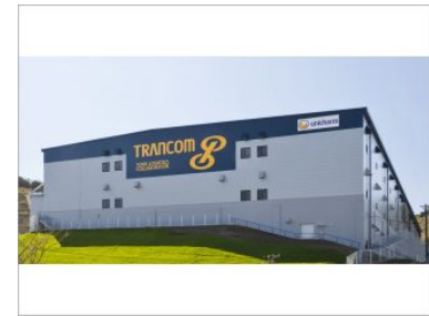
トランコム(株)静岡ロジスティクスセンター