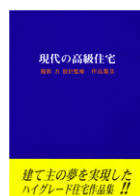
現代の高級住宅 ( ) (株式会社SCC刊 '0610)